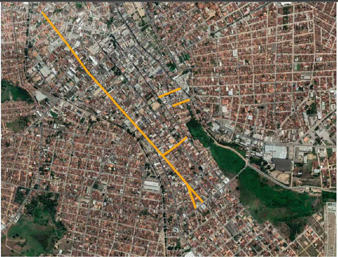
MAPA DE LOCALIZAÇÃO sem escola